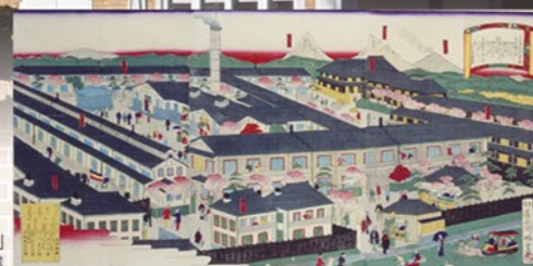
錦絵「上州富岡製糸場」 富岡市立美術館博物館蔵