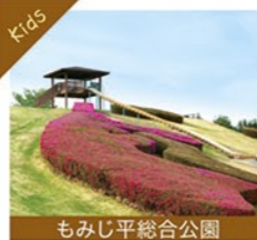
もみじ平総合公園

敷地内には県立自然史博物館や市立美術館博物館があり、秋には真っ赤なもみじを楽しめる総合公園です。お子様が遊べる遊具もあるので、親子連れの方、散歩やジョギングなどをする方にぎわっています。天気の良い日には、赤城、榛名、妙義の山々が見られることも。