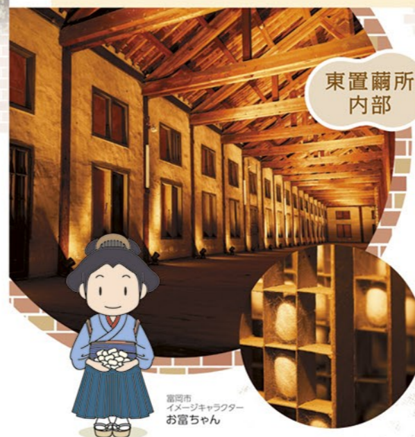
富岡市 イメージキャラクター お富ちゃん